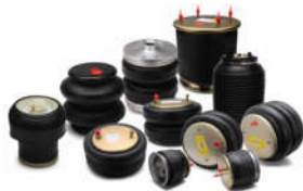
空气弹簧 2004年研发成功并投放市场