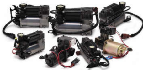
现有3大系列、50多个规格型号 电子气泵2014年研发成功并投放市场